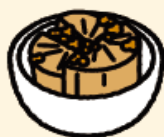
そぼろ煮 (大根入り)