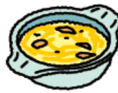
雑炊 (たまご・ささみ入り)