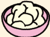
ポテトサラダ (具なし)