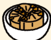
そぼろ煮 (大根入り)