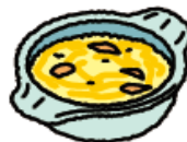
雑炊 (たまご・ささみ入り)