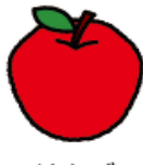
りんご (皮・種なし)