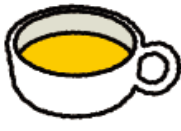
ポタージュ スープ(具なし)