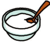
ヨーグルト (プレーン)